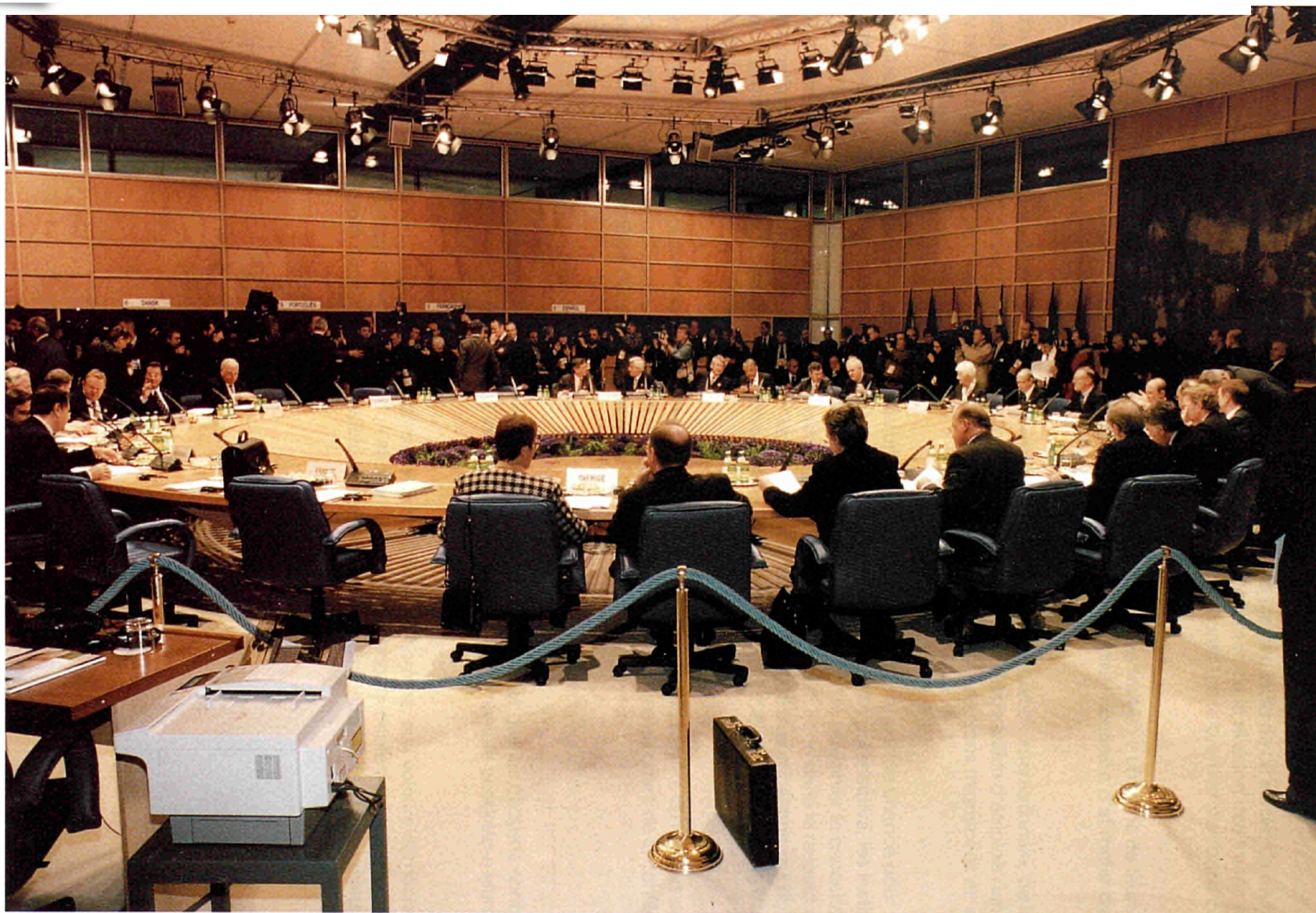
Vue de la réunion du Conseil européen à Turin le 29 mars 1996.