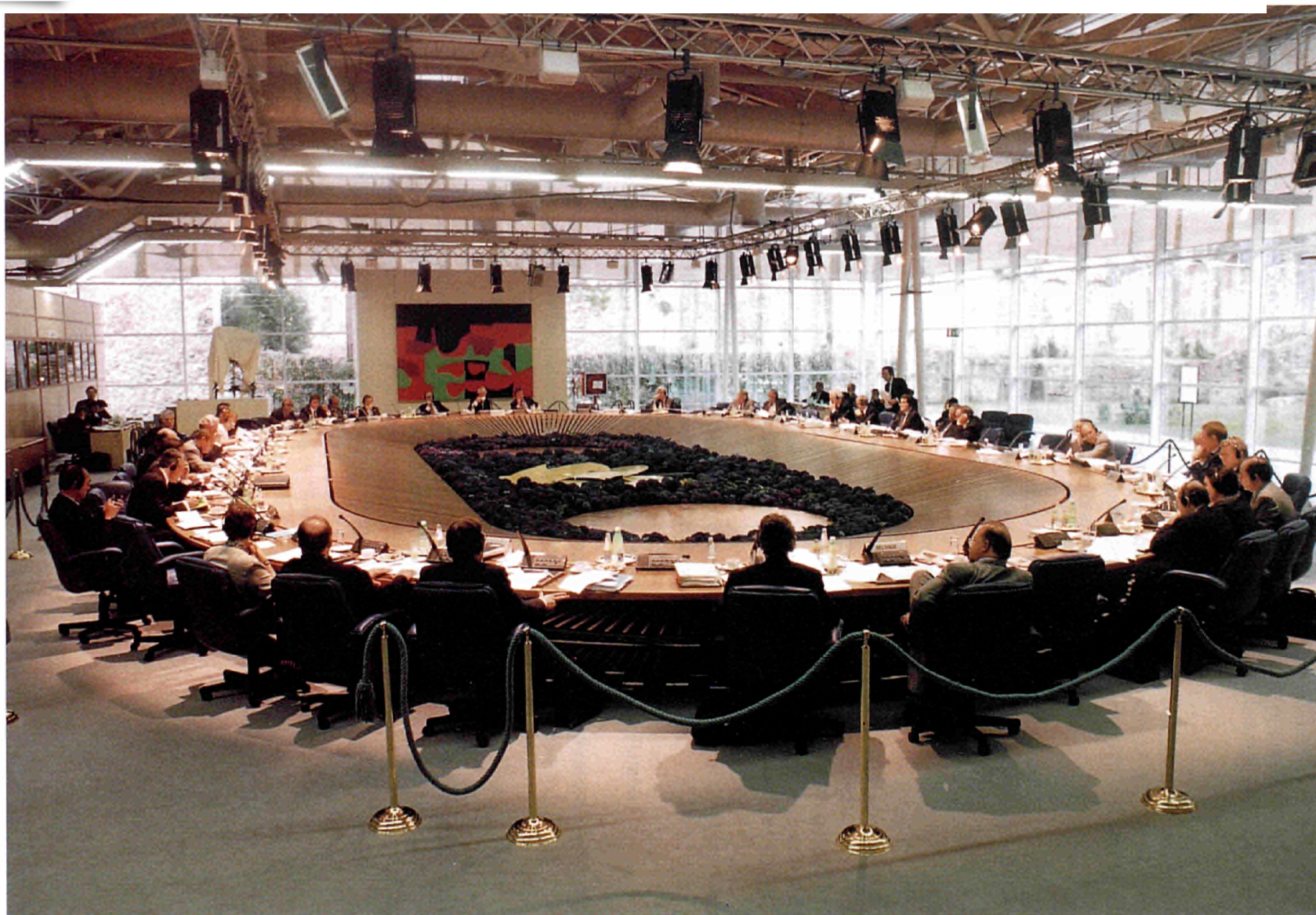
Vue de la réunion du Conseil européen à Florence les 21 et 22 juin 1996.