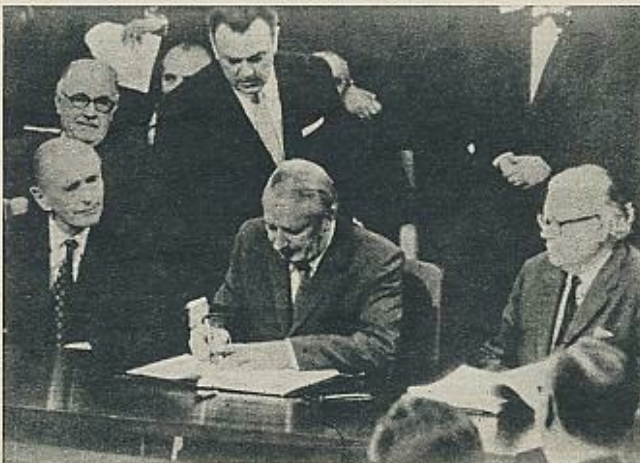
El primer ministro británico, Edward Heath, firma el acuerdo de integración de Gran Bretaña en la Comunidad Económica Europea.