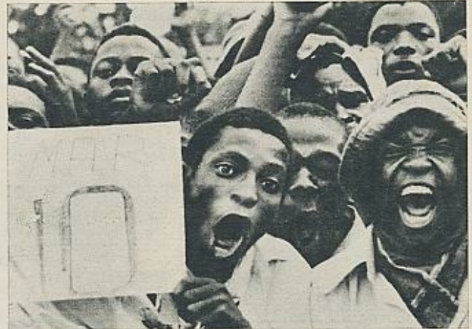
Jóvenes africanos se manifiestan en la ciudad de Monomatapa (Gwelo) protestando por el acuerdo de Gran Bretaña y el régimen de Ian Smith.

EL próximo paso europeo debe estar en la Conferencia de Seguridad, que este año debe comenzar a esbozarse probablemente en Helsinki, en una especie de reunión abierta casi en permanente —aunque no institucionalizada— y que, si todo va bien, comenzaría a celebrarse en 1973, quizá con una perspectiva de años para llegar a acuerdos importantes. Pero en esa perspectiva está la retirada de tropas extranjeras de los países europeos —tropas de Estados Unidos, tropas de la Unión Soviética—, la reducción del Pacto de Varsovia y de la OTAN —con la lejana idea de la desaparición de los dos grupos militares hostiles— y la creación de unas instituciones supranacionales de las que formarán parte no sólo los Diez, sino todos los países europeos, incluidos los socialistas. Es posible que esta superposición política llegue a tener en el futuro mucha más importancia, incluso en lo económico, que la hasta ahora limitada Comunidad Económica Europea.