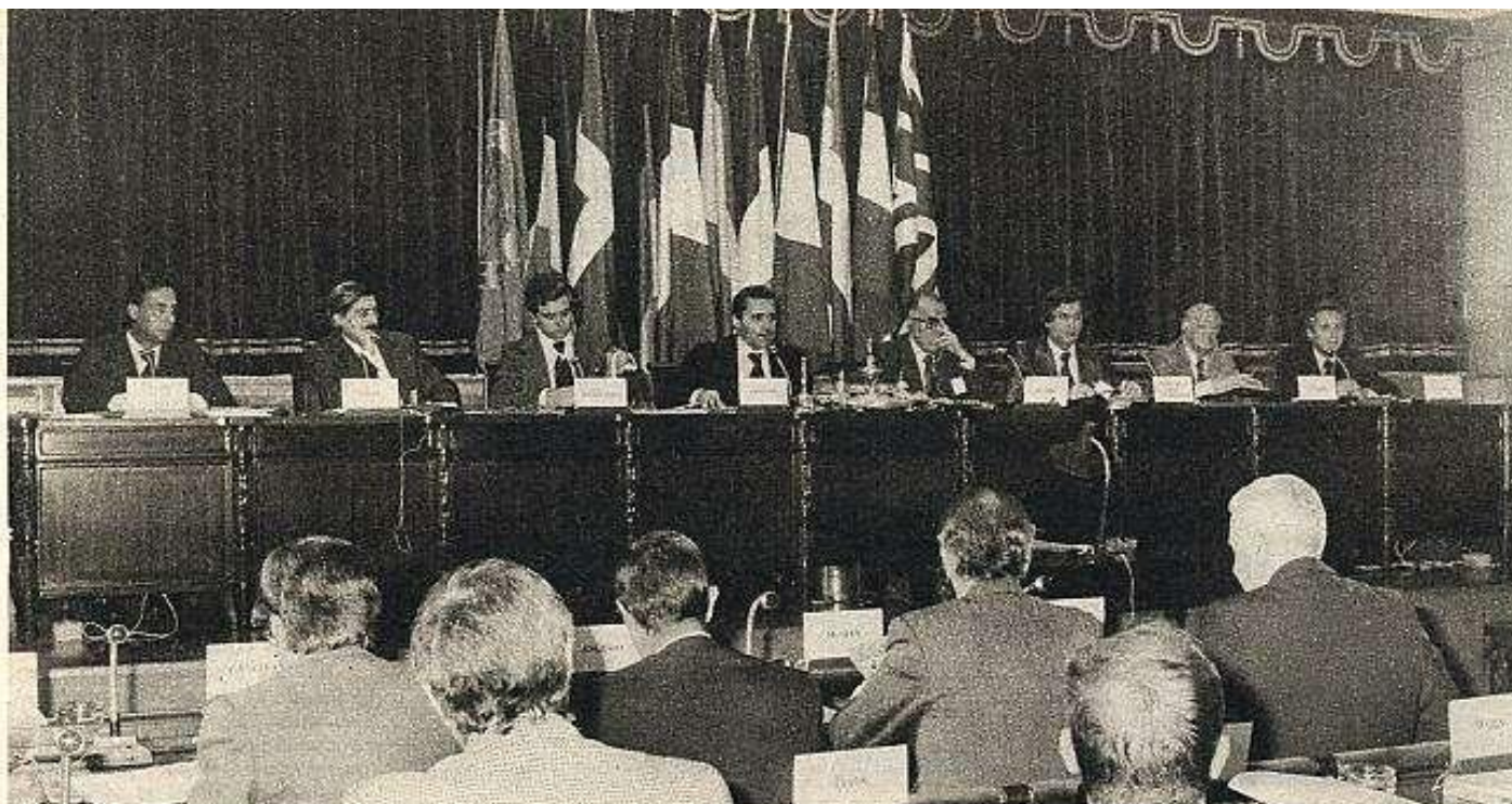
Se muestra una voluntad de ir hacia Europa, pero no se explica bien cómo. (En la foto: reunión de la comisión mixta Parlamento europeo-Parlamento español, que se ha celebrado por primera vez en nuestro país.)