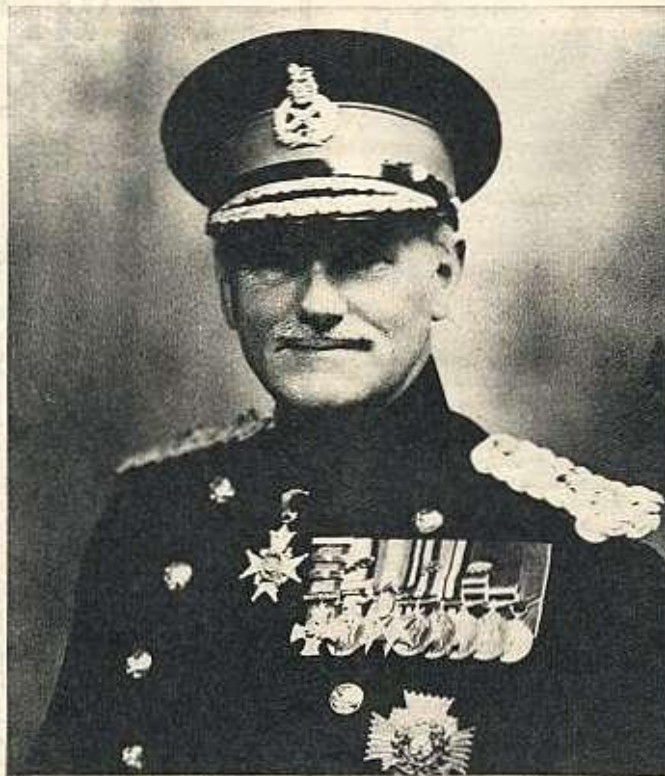
El general sir Walter Walker, ex jefe de las Fuerzas de la OTAN en el Norte de Europa, actualmente a la cabeza de la organización político-militar UNISON.

La primera alarma no la ha dado ningún desconocido ni desde un periódico cualquiera: ha sido lord Chalfont, gran especialista en cuestiones militares, el que en el "Times" ha publicado un artículo con este título: "¿Va Gran Bretaña hacia una toma del poder por los militares?". Lord Chalfont señala el desorden del país y su caída económica: no deja de culpar, como es costumbre en el conservadurismo, a los sindicatos y a los obreros, y siguiendo la línea de Heath, indica que estos sindicatos se están sobreponiendo a los poderes políticos democráticos, y que la situación puede incitar a los ciudadanos a buscar soluciones de gobierno no democráticas. No es el único que se expresa así: Bernard Crick, profesor de Ciencias Políticas en Londres, ha explicado en el "Observer" que las condiciones objetivas de Gran Bretaña indi-