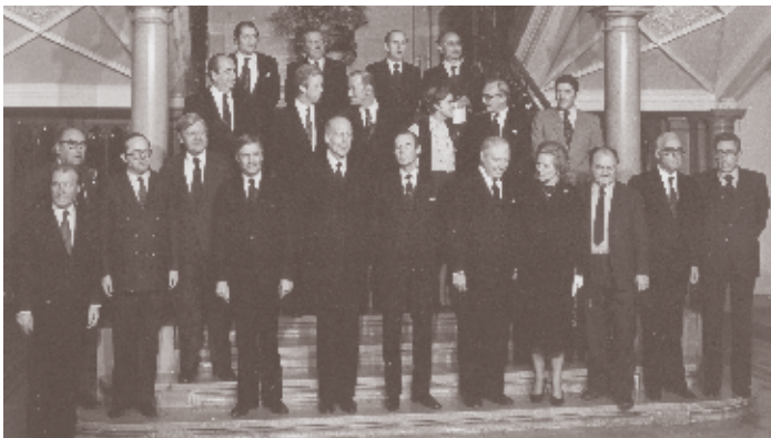
Photo de famille du dernier Conseil européen réunissant les chefs d'État ou de gouvernement des Neuf, ainsi que le président de la Commission, tenu à Luxembourg les 1 et 2 décembre 1980.

Le CVCE mène actuellement un vaste projet consacré à l'œuvre et à la pensée européennes de Pierre Werner, basé principalement sur l'exploitation intensive des archives familiales Werner, ouvertes pour la première fois à des fins de recherche.